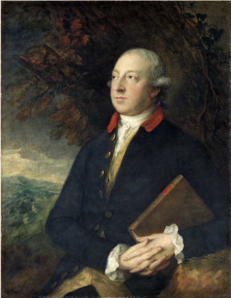
'Thomas Pennant' gan Thomas Gainsborough, 1776